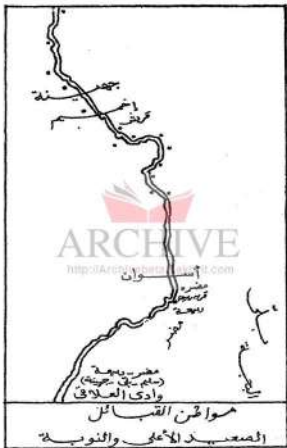
خريطة رقم (٣) نقلًا عن البري: القبائل العربية في مصر، ص ٣٢٢.