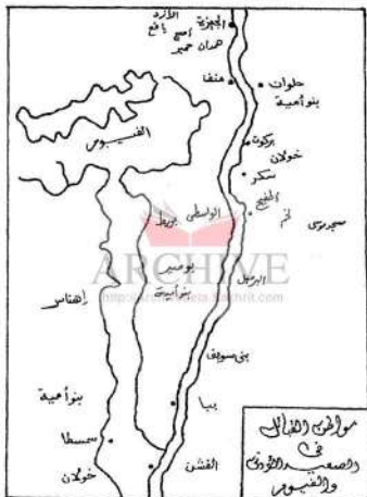
خريطة رقم (١) نقلا عن البري: القبائل العربية في مصر، ص ٣١٩.