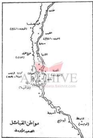
خريطة رقم (٢) تفلأ عن البري: القبائل العربية في مصر، ص ٢٢١.